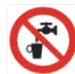
acqua non potabile