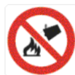
divieto di spegnere con acqua