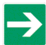
freccia di direzione