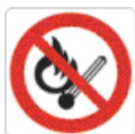
vietato usare fiamme libere