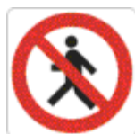
vietato ai pedoni