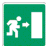
direzione uscita d'emergenza